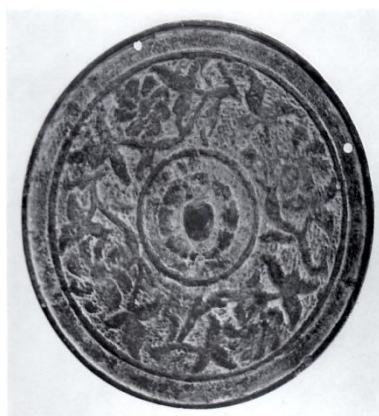
—写真2 捻花唐草文鏡—