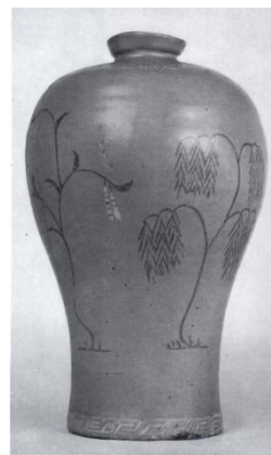
—写真3 青磁象 嵌蒲柳文梅瓶—

対馬にある海外からの文化財は、対馬の歴史的な状況から考えて、倭寇によって奪略された物もあるが、多くはその時代の直接交流によって対馬にもたらされたものであり、このような対馬の文化財は、日本と朝鮮半島の交流のあかしとして、東アジア美術史の上で特異な意義を担っていると考えられている 24 。